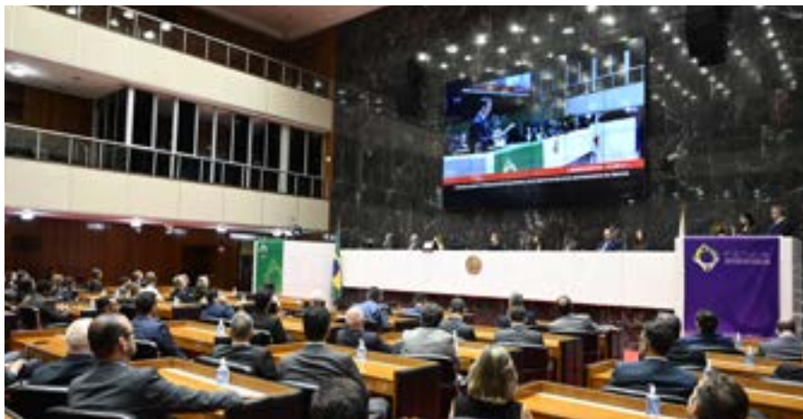
Plenário da ALMG lotado em homenagem à Fenia