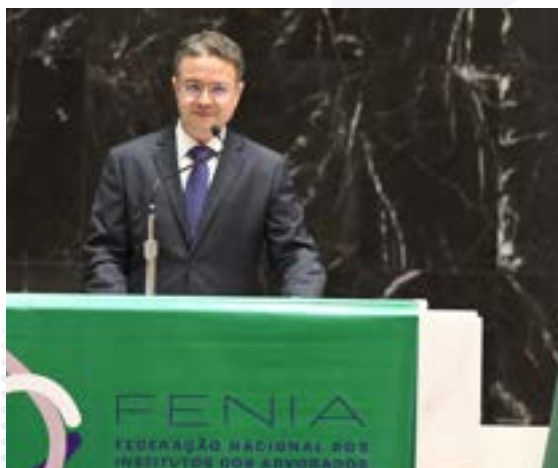
Presidente da Fenia discurso no parlamento