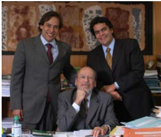
Sepúlveda Pertence e os filhos

Muito antes de ser nomeado pelo presidente José Sarney para assumir a cadeira de ministro do STF, o mineiro e atleticano José Paulo Sepúlveda Pertence já possuía longa carreira a serviço do Direito e da Democracia.